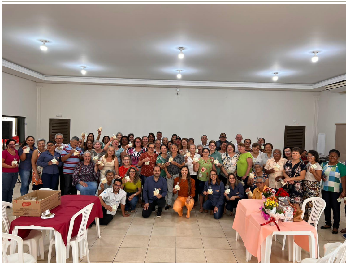
Evento realizado com os segurados do PreyBrilhante: Palestra e distribuição de buchas vegetais