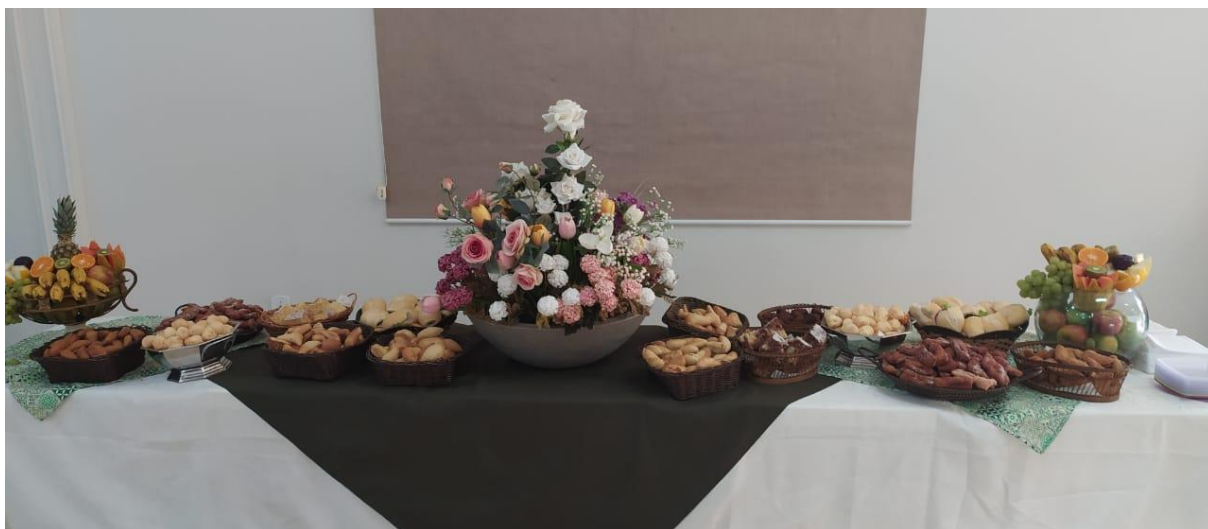
Imagem 5:Café da manhã com a palestra “ Vivendo com qualidade” realizado em 2022 .