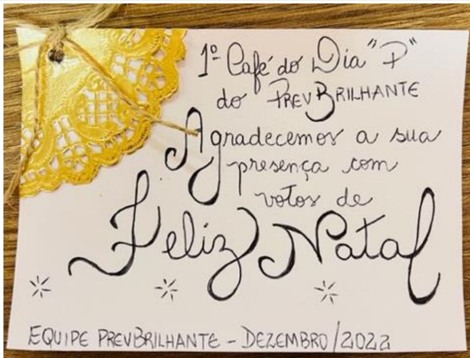
Imagem 6: Lembrança elaborada para os aposentados e pensionistas participantes

4. Divulgação da data do primeiro Café do dia “P” do PrevBrilhante nas redes sociais do PrevBrilhante e no grupo de whatsapp “Segurados do PrevBrilhante”.