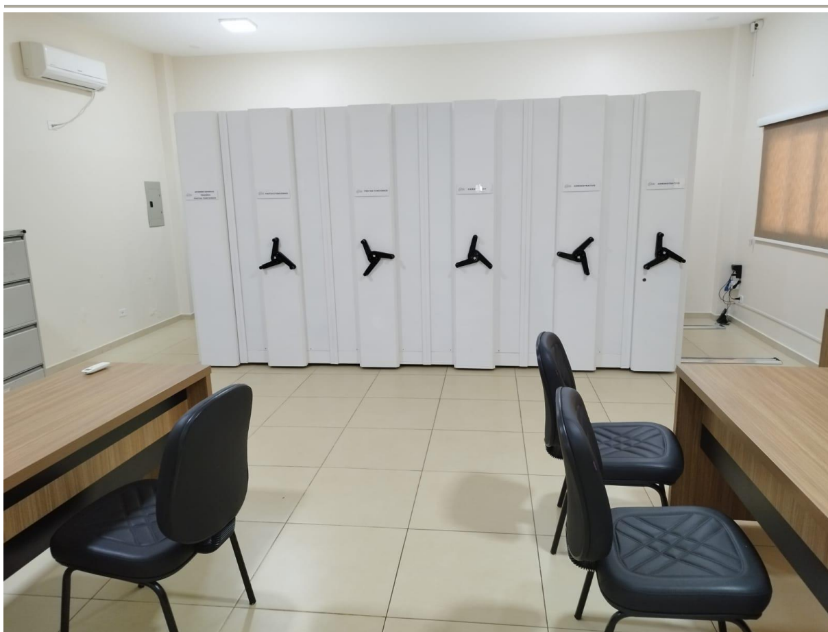
Imagem 4:Sala administrativa e sistema de arquivo do PrevBrilhante