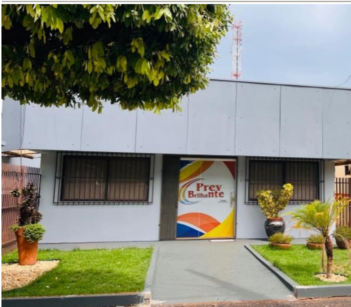
Imagem 1: Fachada atual do PreyBrilhante: sede própria